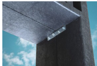
E' possibile connettere 2 panchine avvitando i due piedi mediante l'utilizzo di Gova FIX