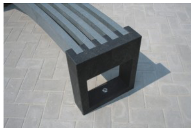
Fissaggio con tasselli inox